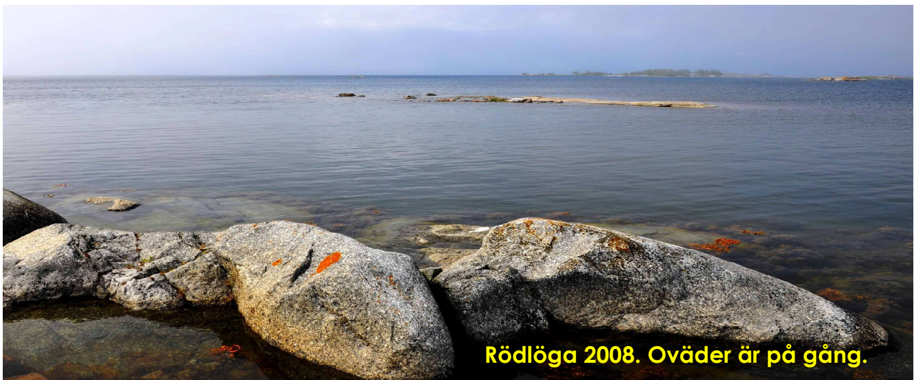
Rödlöga 2008. Oväder är på gång.