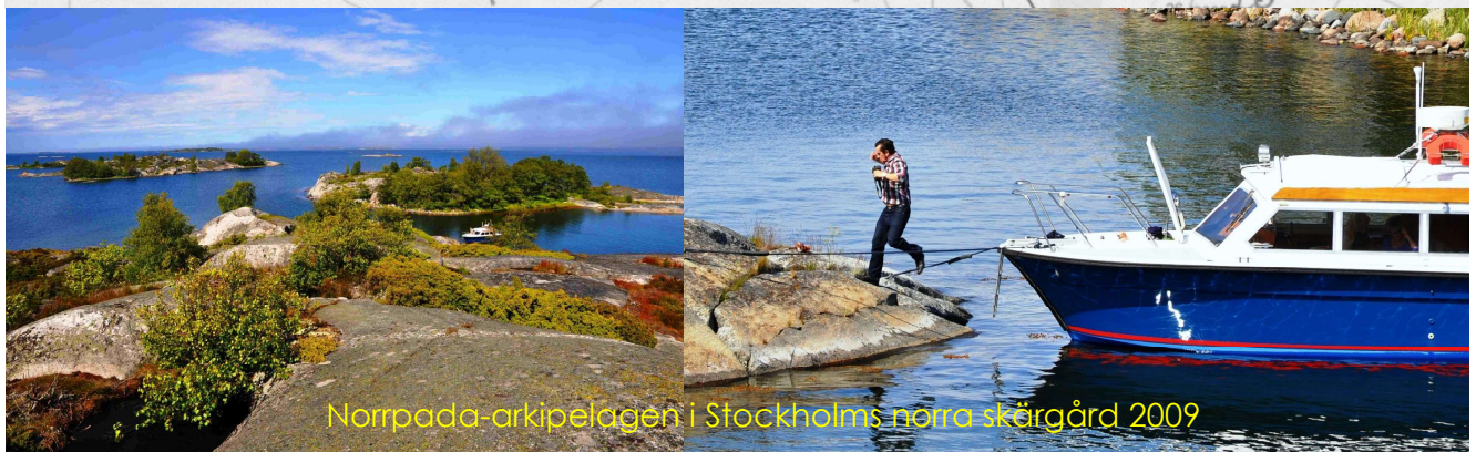
Norrpada-arkipelagen i Stockholms nära skärgård 2009